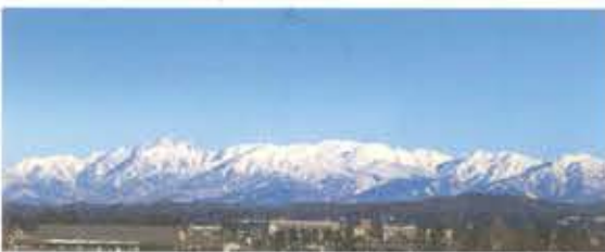
砺波市美術館3階展望室より望む立山連峰