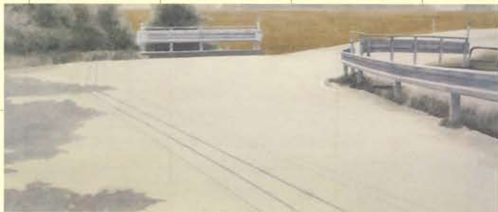
山田健治「在る日の風景」2009