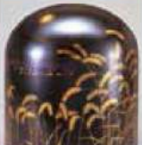
新敷幸弘《乾漆器 野辺》1994