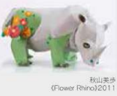
秋山美歩 《Flower Rhino》2011

4月13日(土)～6月9日(日) ※5月14日(火)、20日(月)、27日(月)は休館いたします 紙でユーモラスな動物を制作している兵庫県在住のペーパークラフト作家・秋山美歩(1982～)がとなみ野を背景に「紙の動物園」を作り上げます。 観覧料:一般・高校生以上1000円/小・中学生300円/小学生未満無料 (企画展示室)