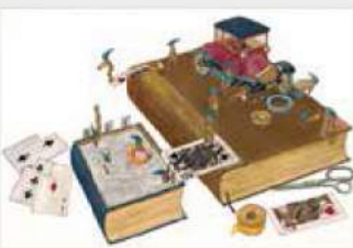
安野光雅《ふしぎなえ》1968 津和野町立安野光雅美術館 ◎空想工房