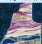
藤田和十《記憶の風景》1996