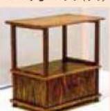
林 西三 《古野杉砂置試漆小櫃》1991