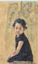
藤森兼明《アマール》1997