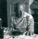
ロベール・ドアノー 《ピカソのパン》1952