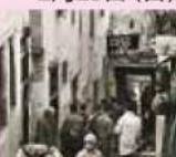
高道 宏《メアイナの路地》1991