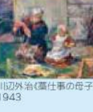
川辺外治《葛仕事の母子》1943