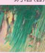
高島圭史《ねがひほし》2012