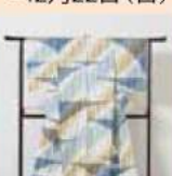
山下郁子 《絨織着物 風にのって》2008