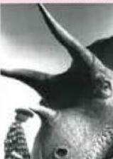
ジャンル・シーフ 《ハーバース/ザ・ニューヨーク》1963 ©Jeanloup Sieff