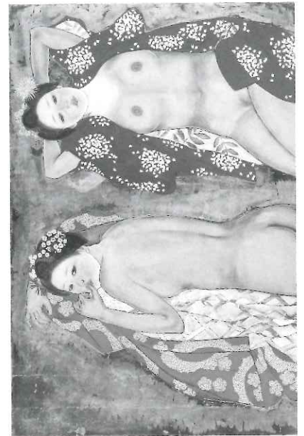
石本正「二人の踊子」1972年

1948年、旧態依然とした日本画壇に不満や危機感を持った東京・京都で活動する秋野不矩、上村松篁、山本丘人ら中堅の日本画家13名によって在野団体「創造美術」が結成されました。創造美術は、世界性に立脚する日本絵画の確立を目指し、創立会員と新進気鋭の画家達が自由な創造を行い戦後の日本画壇に強烈な刺激を与えました。その後、新制作派協会と合流し「新制作協会日本画部」を経て1974年に「創画会」を設立し現在へ続いています。