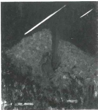
柴田長俊「山の沈黙」2011年