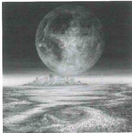
藤田志朗「十六夜の時」2010年